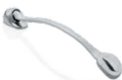
■ Class II