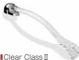
■ Clear Class II