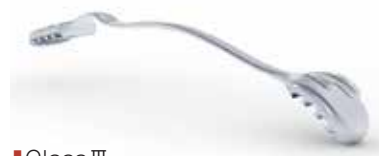
■ Class III